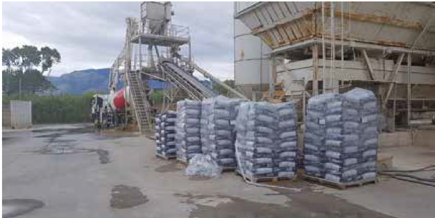
Il compound Tekna Chem nell'impianto di premiscelamento

negativi sul litorale Domitio/Aurunco. Il progetto affiancherà, nel corso del suo sviluppo, l'attuazione del futuro, mastodontico "Masterplan per il litorale domitio-flegreo" per il quale si sta ragionando su proposte pari a circa 4 miliardi di euro di finanziamenti. L'obiettivo, sempre lo stesso: affrontare e risolvere una volta per tutti il problema della riqualificazione di una delle aree di maggiore prospettiva di sviluppo della Campania.