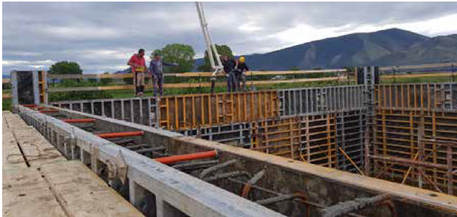
Getto del calcestruzzo nei casseri di una vasca

Lotto 2 - Comuni di Mondragone, Castelvoturno, Villa Literno; 35.955.631,40 euro (lavori in corso).