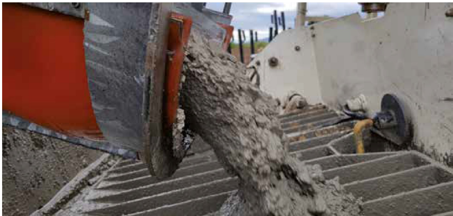
Consistenza e coesione dell'impasto

Un calcestruzzo con Aeternum Proof risulta avere, in ultima analisi, impermeabilità totale, anche all'aria. O, in altre parole "permeabilità zero". Nulla che possa danneggiare, dunque, passa. Nulla si insinua. E l'impasto, come si suole dire, è tutta un'altra cosa.