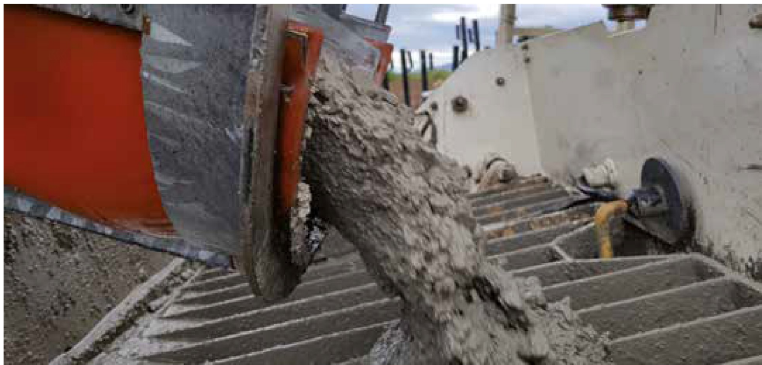
Consistenza e coesione dell'impasto

Un calcestruzzo con Aeternum Proof risulta avere, in ultima analisi, impermeabilità totale, anche all'aria. O, in altre parole "permeabilità zero". Nulla che possa danneggiare, dunque, passa. Nulla si insinua. E l'impasto, come si suole dire, è tutta un'altra cosa.