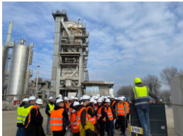
Visita alla centrale di produzione asfalti.

un'esperienza diretta e tangibile del settore industriale, aprendo loro le porte verso un apprendimento più significativo e appassionante. Riteniamo che il coinvolgimento diretto delle aziende e delle imprese locali (quali ad esempio Cave Pesenti , oggetto di una recente visita molto apprezzata dai partecipanti) sia fondamentale per arricchire l'esperienza formativa degli studenti.