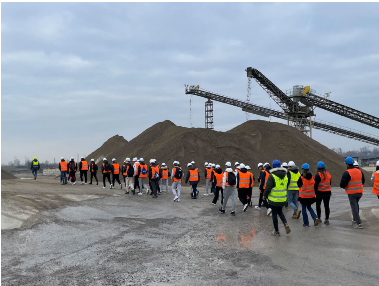
Suddivisione e stoccaggio delle varie pezzature di aggregati.

Si è cercato in tutti i modi di far respirare ai ragazzi il "profumo del lavoro", quello che li avvicina concretamente alla realtà professionale che li attende oltre i confini dell'aula scolastica. Questo interesse non è solo una moda passeggera, ma riflette una consapevolezza sempre più diffusa circa l'importanza di preparare gli studenti non solo con conoscenze teoriche, ma anche con competenze pratiche ed esperienze dirette.