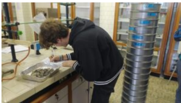
Analisi in laboratorio presso l'IT Enrico Mattei di Rho (MI): caratterizzazione degli aggregati.

La mancanza di queste figure sul mercato del lavoro rappresenta un vuoto significativo che ha un impatto pesante sulla qualità dei lavori e, di conseguenza, sull'economia del Paese. È evidente che la presenza di professionisti qualificati in settori cruciali come la gestione della qualità dei materiali, della sicurezza e della certificazione è fondamentale per garantire standard elevati e competitività sul mercato globale.