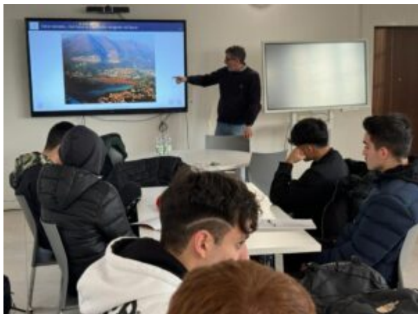
Lezione teorica sul calcestruzzo.

Tra queste nuove specializzazioni troviamo il "Responsabile della qualità nell'impresa", una figura cruciale per garantire standard elevati di produzione e servizio all'interno delle aziende. Il "Responsabile della sicurezza in cantiere" è un'altra figura di rilievo impegnata nella tutela della salute e della sicurezza dei lavoratori sul luogo di lavoro.